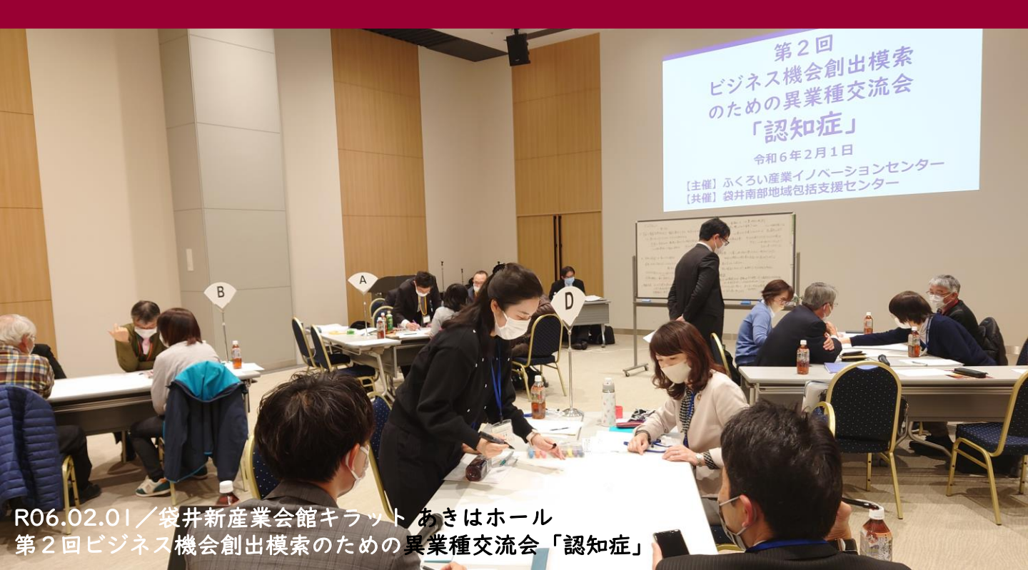
R06.02.01 / 袋井新産業会館キラットあきはホール 第2回ビジネス機会創出模索のための異業種交流会「認知症」