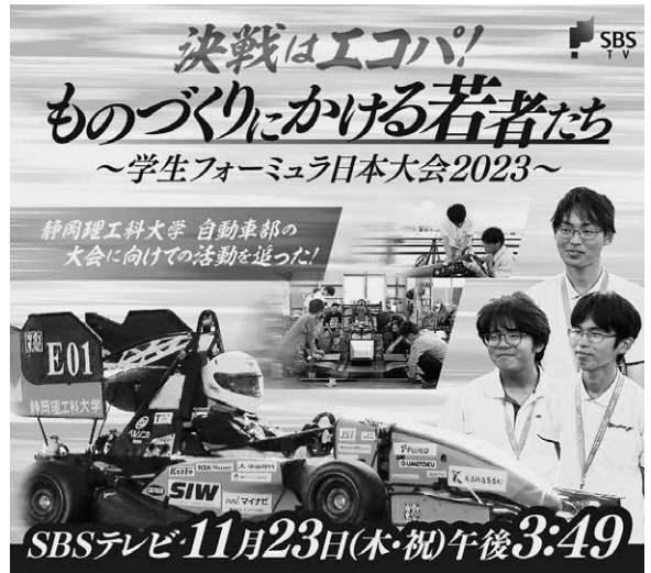
▲Youtubeから「決戦はエコパ」で検索!

※ エンデュランス：2人のドライバーが交代し約20kmを走る耐久レース。走行時間によって車の全体性能と信頼性を評価する。完走しないと全くスコアが得られないため、完走できるかどうか総合成績に大きく影響する。