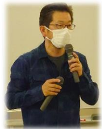
ワークショップ コーディネータ