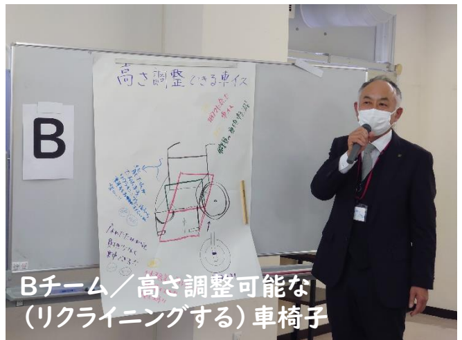
Bチーム／高さ調整可能な（リクライニングする）車椅子