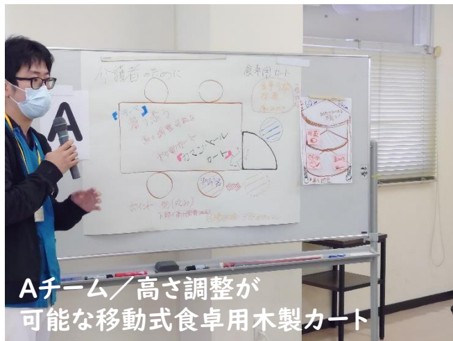
Aチーム／高さ調整が可能な移動式食卓用木製カート