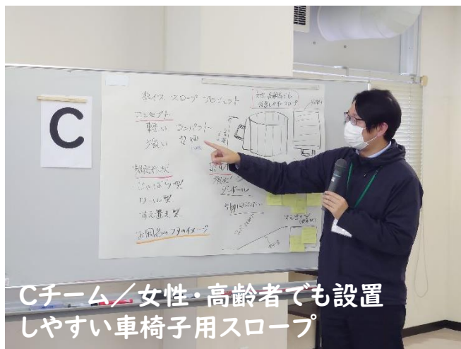
Cチーム／女性・高齢者でも設置しやすい車椅子用スロープ